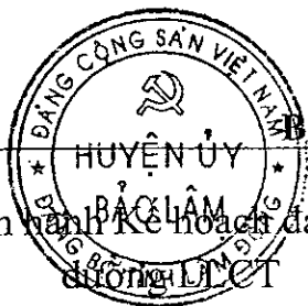
Biểu 5. VIỆC HỌC TẬP LÝ LUẬN CHÍNH TRỊ