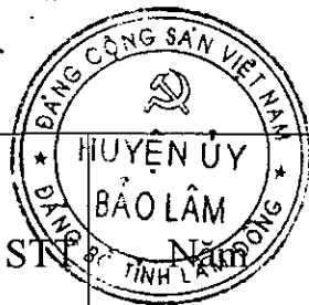
Biểu 7. CÔNG TÁC KIỂM TRA, BÁO CÁO