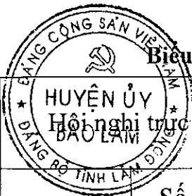
Biểu 3. TÌNH HÌNH TỔ CHỨC QUẢN TRIỆT NGHỊ QUYẾT SỐ 37-NQ/TW